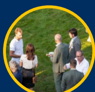
Ondernemersborrel regio Zwolle