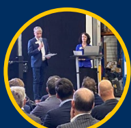
Bedrijfsbezoek VB Airsuspension